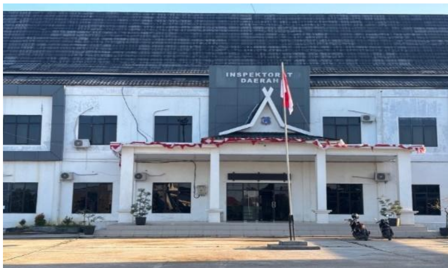
Gambar 2.1 Gedung Inspektorat Daerah Kab. Tanjung Jabung Barat

Inspektorat Daerah Kabupaten Tanjung Jabung Barat merupakan unsur pengawas penyelenggaraan pemerintahan Daerah, yang dipimpin oleh Inspektur dalam melaksanakan tugasnya bertanggung jawab kepada Bupati melalui Sekretaris Daerah. Inspektorat Daerah mempunyai tugas membantu Bupati membina dan mengawasi pelaksanaan urusan pemerintahan yang menjadi kewenangan Daerah dan tugas pembantuan oleh Perangkat Daerah.