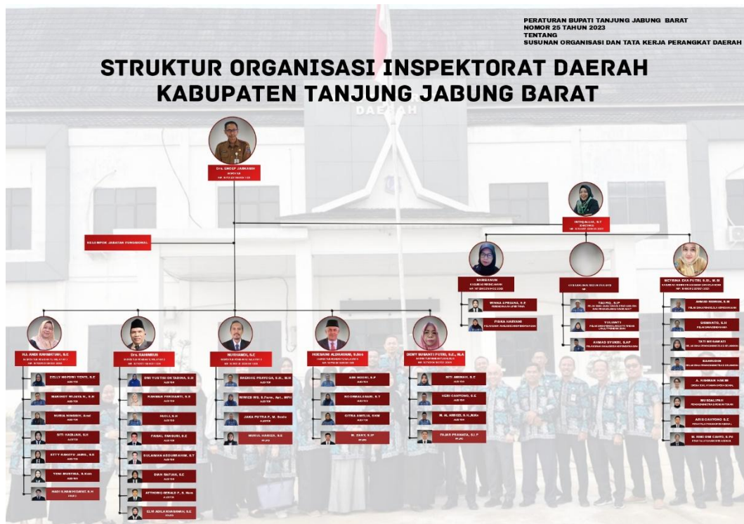
Gambar 2.2 Struktur Organisasi

Struktur organisasi Inspektorat Daerah sebagaimana dimaksud diatas dapat dilihat pada gambar berikut :